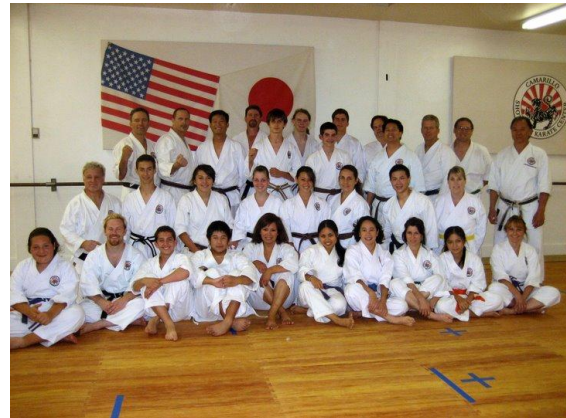
Abb. 1: Meine Trainingsgruppe

Gastfreundlich wie fast alle Kalifornier, wurde ich eingeladen für den Rest meines Aufenthalts so oft ich wollte (gratis) mitzutrainieren. Immerhin ist das Camarillo Shotokan Karate-Do Dojo ein kommerzielles Dojo, von dem Sensei Young lebt.